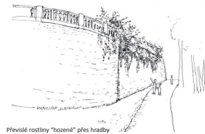
Převísle rostliny "hozené" přes hradby