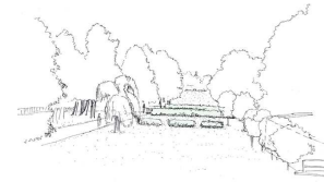
Vylepšený výhled do parku z parteru